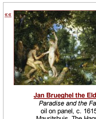
Jan Brueghel the Elder