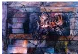
Addio, 1949, 54x73cm [Vedi la foto originale]

Alfonsine (RA) - dal 10 aprile al 17 maggio 2009 Eva Fischer - I colori del tempo