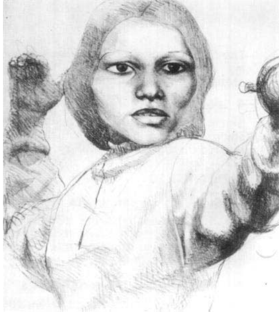
« L'escrimeuse » d'Hugo Attardi

des lavandières et Monet avec des nymphéas... » En aparté, signalons que Rabin participa aux Jeux Olympiques de 1928... comme boxeur.